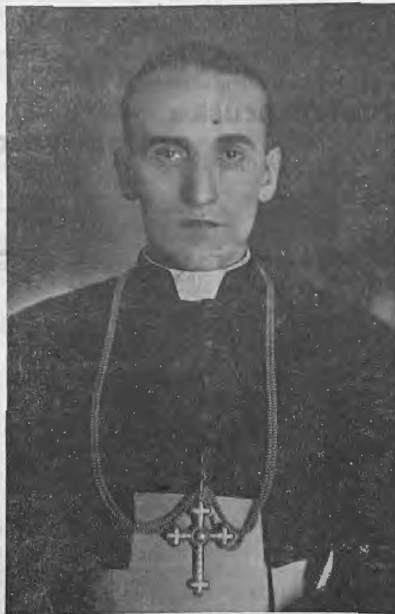
PREUZV. GOSPODIN DR. ALOJZIJE STEPINAC, NADBISKUP-KOAJDUTOR

Gospodin u svojoj Premudrosti, sveta Stolica u svojoj ljubavi prema našem narodu i Hrvatski metropolitita u svojoj brizi životni dali su zagrebačkoj nadbiskupiji i štavom našem narodu čovjeka, koji će Božjom pomoći ispuniti nade, koje se u nj postavljaju. Novi nadbiskup - koadjutor po svom dosadašnjem životnom razvitku i radu opravdava nade, želje i izgled sv. Crkve, svog nastupira, te klera i vjernika. On je izrastao iz sredine, koja je kroz vijekove najpoptornije i najsigurnije sačuvala kapital, koji su Hrvati stekli primanjem sv. krštenja i prenosili ga iz generacije u generaciju. Njegovo je rodno mjesto, u kojem se i odgojilo, najbliži hrvatski seljački kraj, gdje su u najplemenitijem obliku u tisućgodinjem neprekidnom kontinuitetu sačuvala tradicionalna odanost sv. vjeri, istinska pobožnost, čisti seljački karakter, ljubav prema zemlji natopljenoj krvlju i znojem. On je najintenzivnije kao vojnik na fronti proživio najkrvavije prirove svjetskoga rata. On je bio i student i običan seljak. On je sin pobožne obitelji, koji je dugo razmišljao i borio se